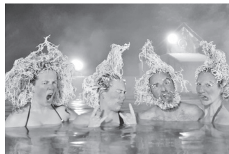
上下「凍った髪の毛のおもしろさを競う「ヘアフリーズ・コンテスト」