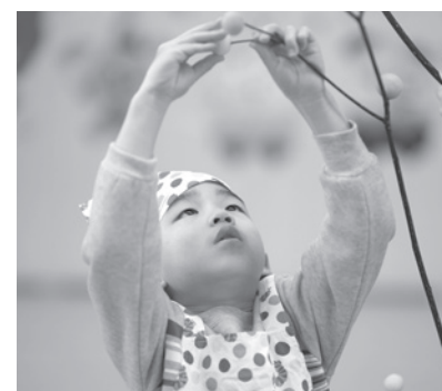
▶願いを込めて団子を枝に

1 月13日に湯野上保育所で団子さしが行われました。団子さしは一年の豊穡や家内安全、そして無病息災を願う小正月（1月15日）の伝統行事で、主に東北地方に受け継がれている文化の一つです。町内保育所ではこうした伝統を次世代へ受け継ぐと、毎年この時期に団子さしを実施しています。