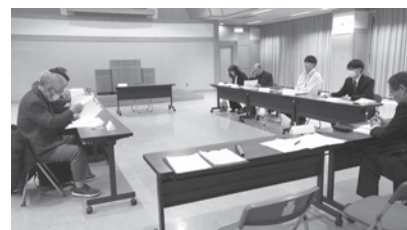
第1回男女共同参画社会推進協議会

家事育児等を分担することとは、女性の負担を減らすだけでなく、男性の生き方の選択肢を広げます。「手伝う」という意識ではなく、自分事として取り組むこと。その積み重ねが、家族の絆を深め、誰もが輝ける社会を創る確かな力になるはずです。まずは今日、身近な一歩から始めてみませんか。