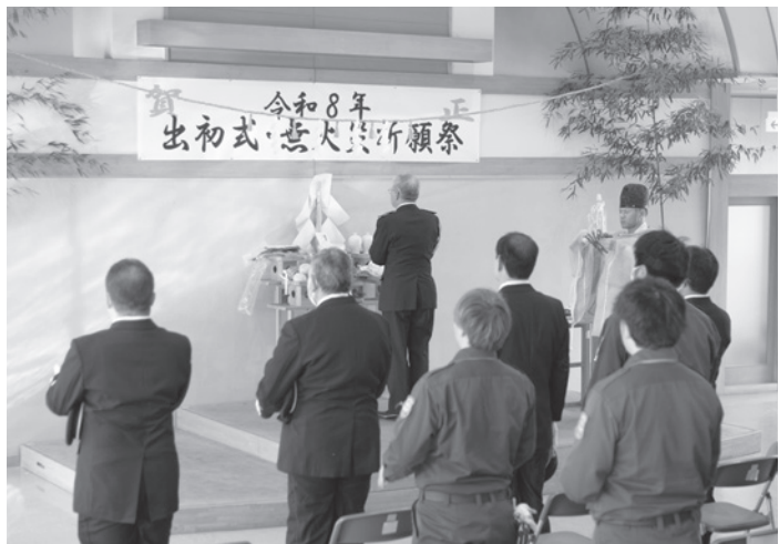
▲無火災祈願神事の玉串奉奠

1 月4日、町役場において消防団並びに婦人消防隊の出初式、無火災祈願祭が開催され、消防団員や婦人消防隊員らが出席しました。