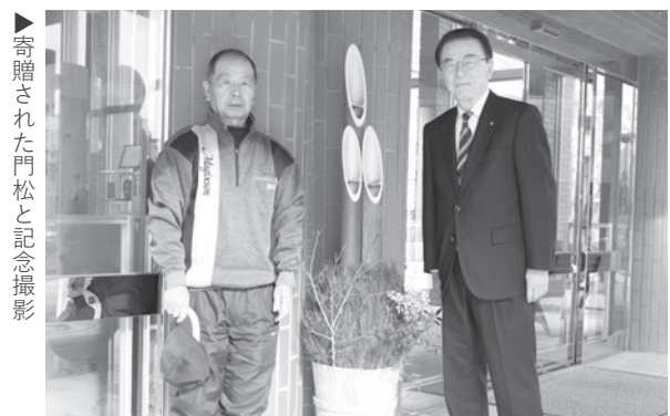
▶寄贈された門松と記念撮影