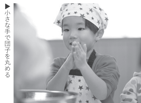
▶小さな手で団子を丸める

園児らの小さな手で、彩り豊かな生地を丸やモミジ型に形成。枝に団子をさす作業においても、終始真剣なまなざしで取り組んでいました。色とりどりの団子で飾られた枝は、冬の保育所を華やかに彩っていました。