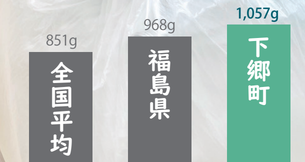
1人1日あたりのゴミ排出量

毎日の暮らしで必ず出るごみ。「どうせ捨てるものだから」と、なんとなくゴミ袋に入れていませんか？実は、家庭から出る可燃ごみの中には、まだ減らせるものや資源として生まれ変わるものがたくさん混ざっています。限られた資源と未来を守るため、今月は、「ごみ減量」について考えてみましょう。