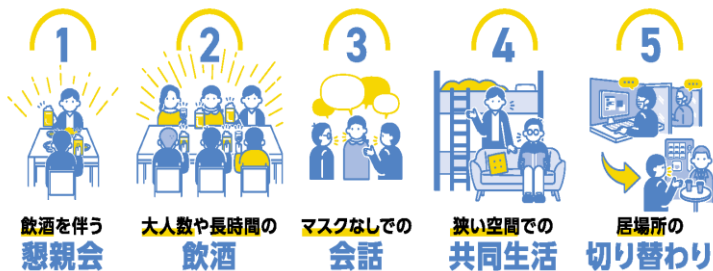
飲酒を伴う懇親会