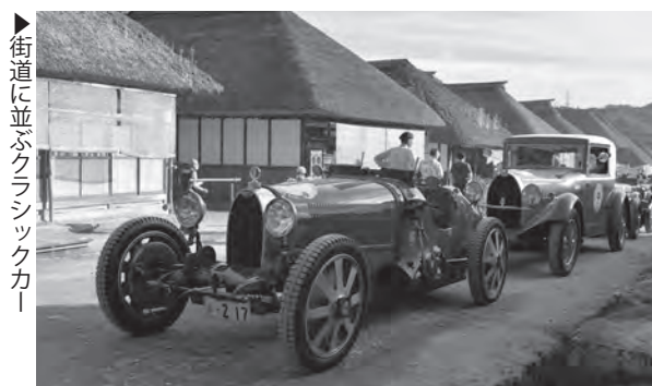
▶街道に並ぶクラシックカー

ラ フェスタ ミッレ ミリア La Festa Mille Miglia 2022