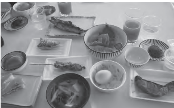
◀訪問先の食材を使った昼食