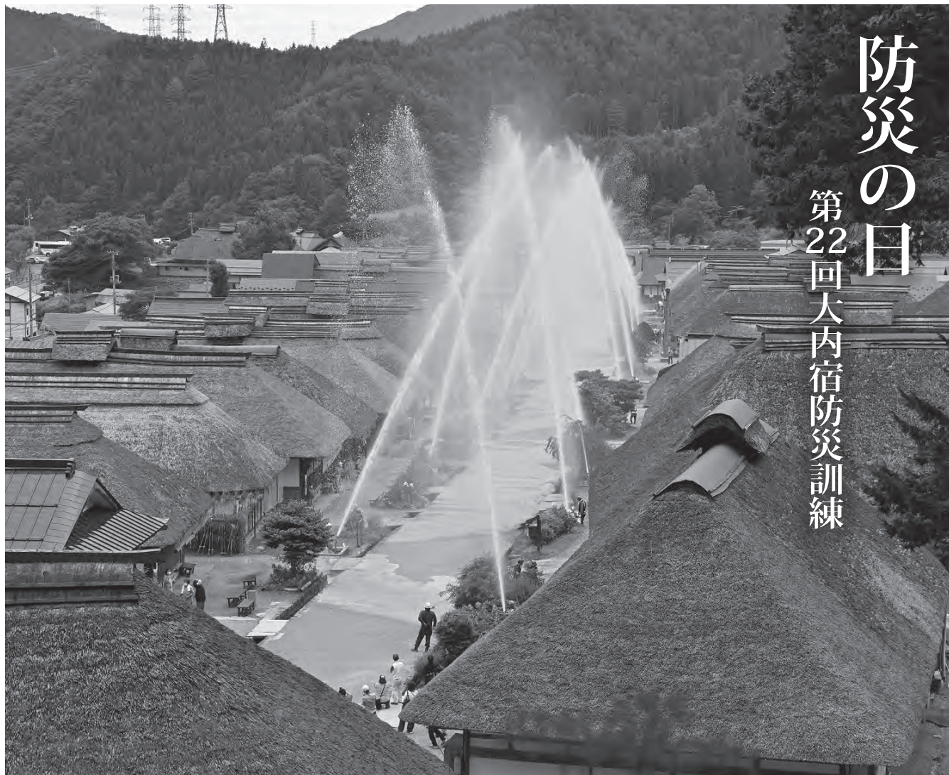
▲見晴台から撮影した放水訓練

9月1日、第22回大内宿防災訓練が行われました。大内宿防災会の主催。地元消防団や婦人消防隊、大内宿火消組の約40名が参加しました。