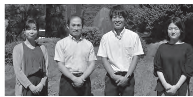
▲(左から)室井先生、古川先生、中島先生、蛭田先生

よう、合唱の練習や総合学習の発表の準備をしています。(集合写真は修学旅行の写真を提供していただきました)