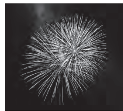
▶夜空を彩った花火

このイベントは、全国旅館ホテル生活衛生同業組合連合会青年部により制定された「宿の日」（8月10日）を広く周知するため、全国の旅館・ホテルが公益社団法人日本煙火協会協力のもと全国各地で花火を打ち上げるものです。7月から12月にかけて各地で開催され、9月3日は下郷町、他、宮城県の鳴子温泉などでも開催されました。