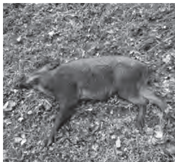
▲捕獲したイノシシ

会津伝統野菜を使った料理教室に参加しました。利用者の方と料理をしながら全体的な補助をしましたが、皆でワイワイしながら作る料理はとても楽しかったです!料理教室を主催者としてやりたいと思いました。