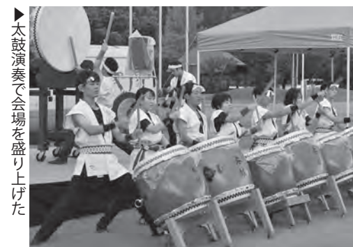
▶太鼓演奏で会場を盛り上げた

このイベントは、全国旅館ホテル生活衛生同業組合連合会青年部により制定された「宿の日」（8月10日）を広く周知するため、全国の旅館・ホテルが公益社団法人日本煙火協会協力のもと全国各地で花火を打ち上げるものです。7月から12月にかけて各地で開催され、9月3日は下郷町、他、宮城県の鳴子温泉などでも開催されました。