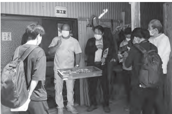
◀しもごう農園で原木しいたけの紹介

会津若松市からの参加者は、それぞれの見学先で食材の特色や調達できる数量などを質問し、熱心に説明を受けていました。