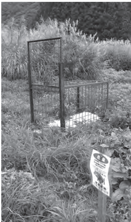
▲イノシシ用のわな

前述のとおり、現在は実施隊の方々と町内をパトロールし、被害状況の確認、わなやカメラを仕掛ける補助をしています。パトロールをしながら鳥獣の習性や行動を教えてください、捕獲した鳥獣