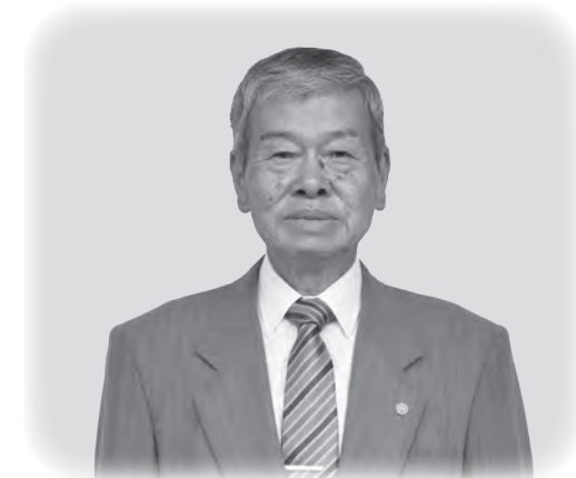
町の行政相談委員