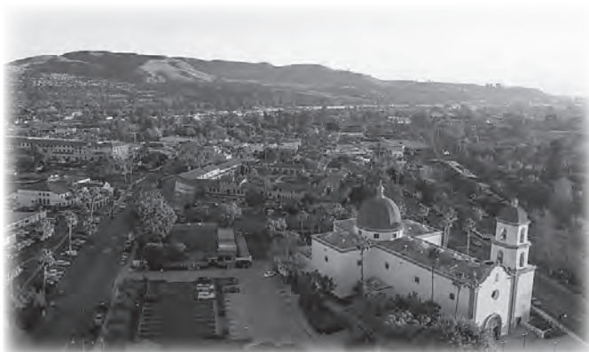
▲上空から撮影したサン・ファン・カピストラーノの街並み

日本に来てから、「一番驚いたことは何ですか」とよく聞かれます。ありきたりな返事かもしれませんが、「雨と湿度」です。