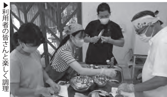
▶利用者の皆さんと楽しく調理

声がかかるかわかりませんが、そのようなイベントを開催するときは声をかけてください。よろしくお願いします!