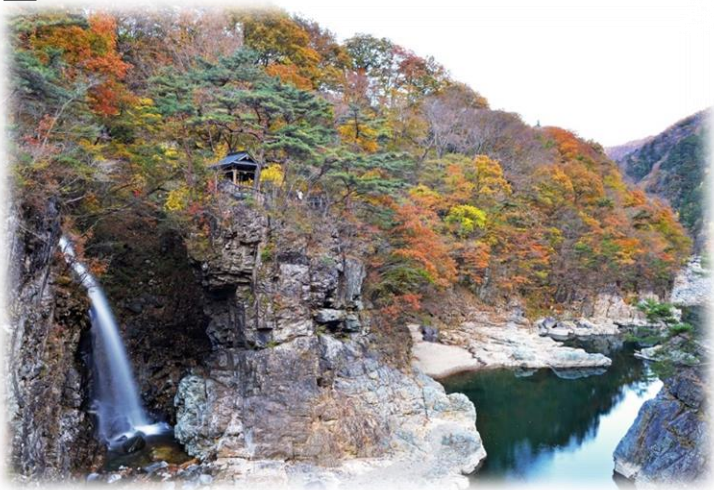
2 虹見の滝

龍王峡をガイドと一緒にハイキングします。龍王峡駅を出発し、むささび茶屋から駅まで戻る約2時間のコースです。道中には見所がたくさん！紅葉の中、ガイドの解説を聞きながらハイキングを楽しみましょう。