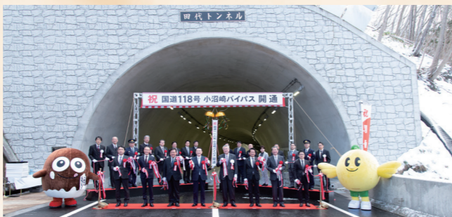
令和6年：小沼崎バイパス開通