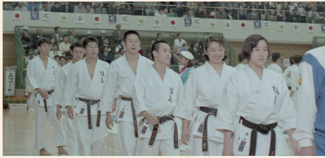
平成7年：第50回ふくしま国体空手道競技開催