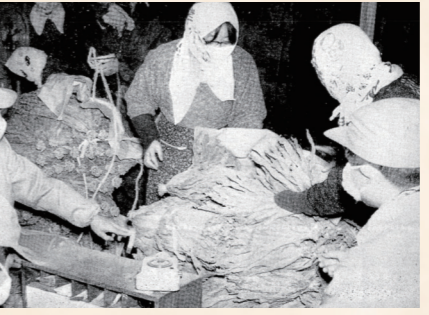
昭和41年：葉たばこの栽培が盛んに