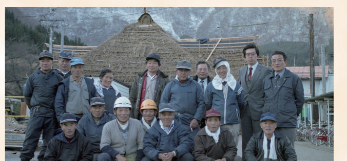
昭和62年：湯野上温泉駅完成