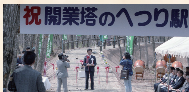
昭和63年：塔のへつり駅開業

昭和63年 1988 1月 国道289号大松川・張平地区法線発表 3月 特定地区公園整備事業（大川ふるさと公園）認定 下郷町議会議員選挙（第9回・定数20人） 4月 町営住宅下中平団地6戸完成 電源開発（株）下郷発電所運転開始 会津線「塔のへつり駅」開業 大松川・中妻・落合分校で完全給食実施 5月 下郷町農業協同組合本所事務所落成 7月 会津フレッシュリゾート構想承認（仮称・大内中山高原リゾート開発構想） 8月 町道中妻・小松川線連絡道開通 11月 大川ふるさと公園敷地造成着工 平成元年 1989 1月 町赤十字奉仕団結成 3月 南会津たばこ耕作組合閉所 5月 新旭橋開通 平成2年 1990 3月 大内・中山リゾート開発を共同で進める東宝（株）との協定を締結 6月 江川小学校新校舎完成 3セクター「会津下郷リゾート開発（株）」設立 7月 ふくしま国体の空手道競技会場