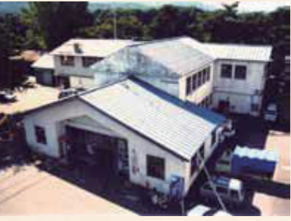
昭和31年：旧役場庁舎完成