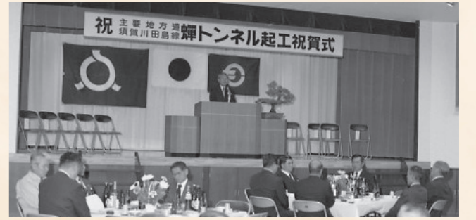
昭和58年：蟬トンネル起工祝賀式

8月 場に内定 下郷中学校大規模改造工事に着手 9月 下郷町社会福祉協議会10周年を記念し社会福祉大会開催 塩沢地区農免農道開通 林道当勢和貢線開通 10月 下郷町商工会30周年記念式典 林道市野大内線開通 櫻木左久雄氏町長に3選 栄橋開通（県道下郷本郷線） 11月 町営住宅（下中平）7戸完成 下郷町観光公社設立 下郷発電所竣工 戸赤分校校舎改築工事起工式 町並み展示館入館者20万人を達成 在京下郷会発足 平成3年 1991 平成4年 1992 3月 下郷町議会議員選挙（第10回・定数18人） 3月 県道須賀川田島線が国道118号に昇格 4月 東部クリーンセンター稼働 7月 ふくしま国体空手道競技会場地として正式決定 10月 国道400号舟鼻トンネル開通 11月 田沼文蔵氏が名誉町民となる 平成5年 1993 3月 大内宿が第1回「美しい日本のむら景観コンテスト」で農林水産大臣賞受賞 4月 新湯野上保育所完成 5月 町消防団が「金ばれん」受賞 12月 下郷幼稚園創立30周年記念式典