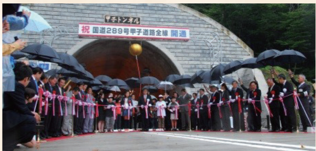
平成20年：国道289号甲子道路開通

令和7年 — 2025 12月 下郷町町制施行70周年記念式典、観光PRキャラクター「ごろみ」が誕生