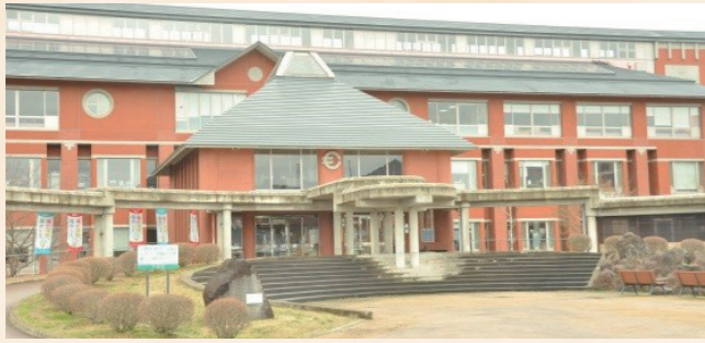
平成9年：役場新庁舎完成