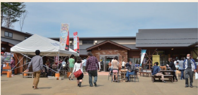
平成21年：道の駅しもごうオープン