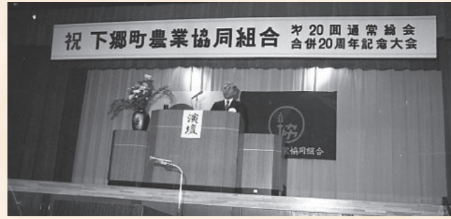
昭和59年：町農業協同組合合併20周年記念大会