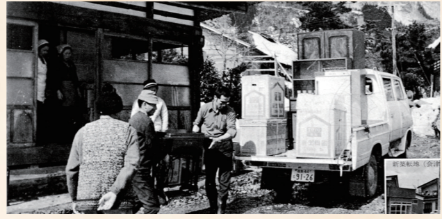
昭和50年：大川ダム建設により沼尾区全戸移転