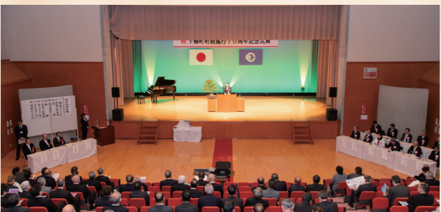
令和7年：町制施行70周年記念式典