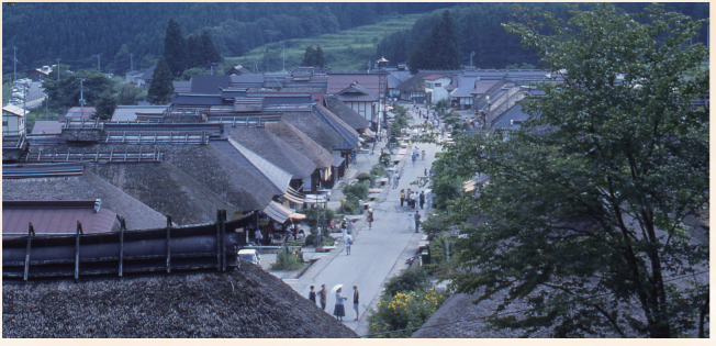
昭和56年：大内宿が重要伝統的建造物群保存地区に選定