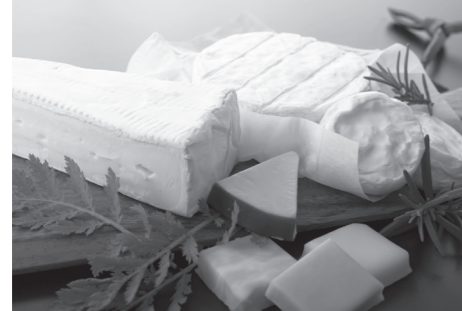
上_ チーズを使ったさまざまなスイーツ 下_ パティ先生大好物のチーズ

私はチーズが昔から好物であり、欠かすことのできない食材の一つです。特にスイーツ作りには欠かせません。パイやパン、ピザといった定番から、フィリピンで親しまれているチーズ味のアイスクリームまで、チーズが含まれるものなら何でも好んで食べています。チーズ特有のクリーミーさと深いコクは、あらゆる料理をより豊かな味わいにしてくれます。