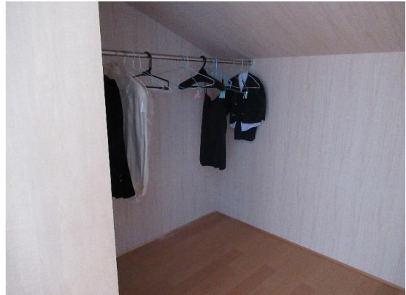
洋室②クローゼット