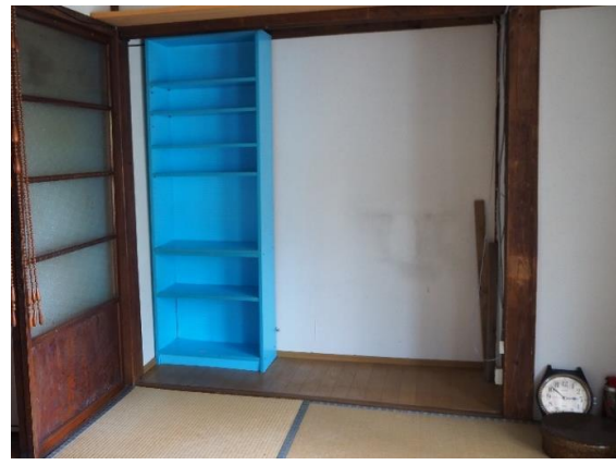
和室 3 (4.5畳)