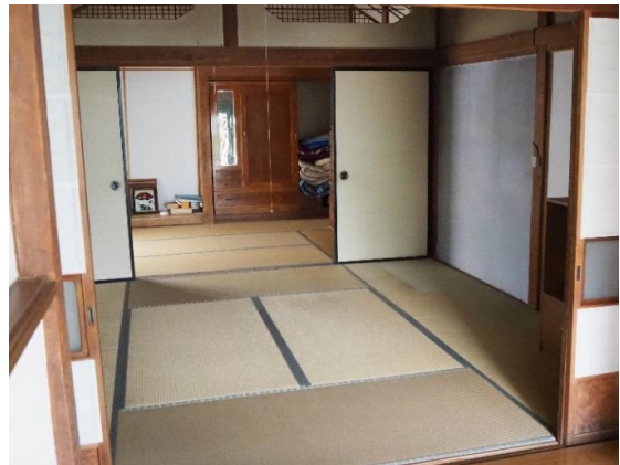
和室 1 (8畳)