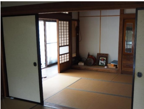
和室 2 (6畳)