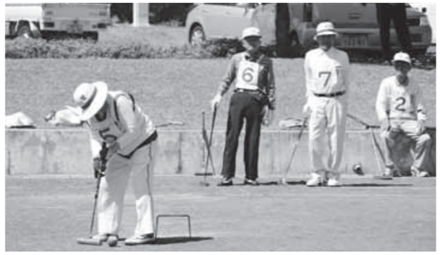
狙いを定めてボールを打つ参加者