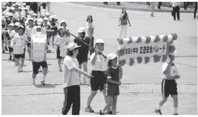
パレードを行う児童