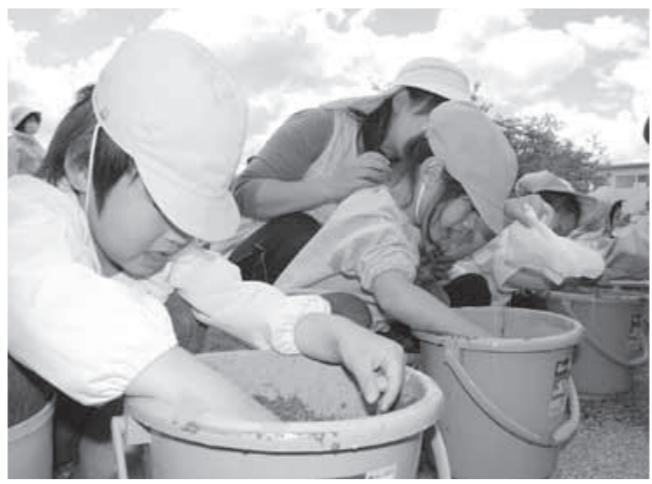
バケツに稲の苗を植える子どもたち

第七回時空の路ヒルクライムin会津は、五月二十三日、県道下郷・会津本郷線「氷玉峠」で開催され、全国各地から約八百名の選手が参加しました。会津美里町の本郷公民館をスタートした選手たちは、氷玉峠頂上のゴールを目指してペダルを踏み込み、自己の限界に挑戦しました。ゴールした選手たちには、大内ダム湖畔の休憩所で、大内区民らにより、しんごろうなどが振る舞われました。