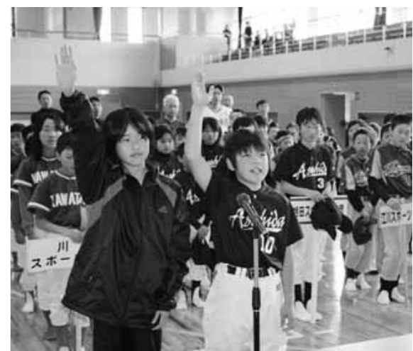
元気に選手宣誓を行うスポーツ少年団の児童

下郷町・西郷村スポーツ少年団交流春季大会は、五月三十日、大川ふるさと公園で開催され、両町村の児童がソフトボールとバレーボールを通じて交流しました。六月五日には、両町村体育協会のスポーツ交流がふるさと球場で行われ、両町村の野球選抜チームが交流試合を行いました。スポーツ少年団の試合の結果は次のとおりです。 ■ソフトボール(1) 川谷(西郷村) (2) 榎の葉(3) 江川(バレーボール) (1) 西郷ジュニアバレーボールクラブ (2) 江川(3) 榎の葉