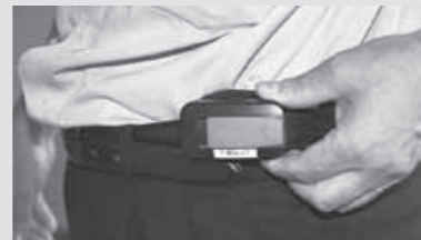
毎日の身体活動をデータ化

町では生活習慣記録機を3か月間無料で貸し出し、生活習慣の改善指導を実施しています。