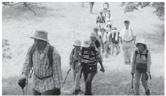
思い思いのペースで歩く参加者

六月十三日、湯野上温泉観光協会主催の中山(金塚山)山開きが行われました。ウォーキングとトレッキングの二つのコースに、県内外から過去最多の二百五十名が参加。新緑に覆われた自然の中でさわやかな汗を流しました。参加者には無料入湯券などが贈られ、ゴールの中山風穴公園では、なめこ汁が振る舞われたほか、宿泊利用券が当たる抽選会などが行われました。