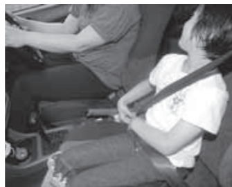
シートベルトの着用の徹底を

夏場は暑さや行楽による疲労、無謀運転等の増加などともなう交通事故が多発します。福島県や県交通対策協議会など関係機関では、交通事故の防止を目的に、「夏の交通事故防止県民総ぐるみ運動」を以下のとおり実施します。