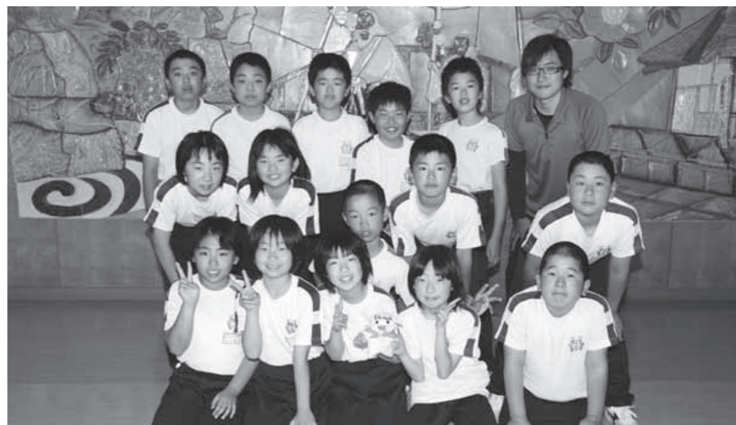
江川小学校 5年生の皆さん