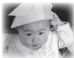
「早く歩けるようになりたいな!」