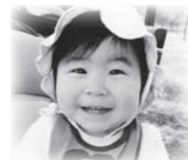
「お散歩大好き(^^) 毎日元気いっぱいです!」