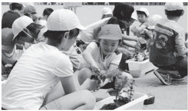
協力しながら苗を植える児童(楢原小)

旭田小学校の交通安全パレードは、六月九日、塩生地区で行われ、全校児童九十六名が交通安全のメッセージとともに素晴らしい演奏を披露しました。南会津警察署の協力によりパトカーが先導。小学校を出発したパレードは、町公民館や役場を巡り、交通安全を呼び掛けました。沿道には、地区住民や保護者らが詰め掛け、児童の願いと演奏に耳を傾けていました。