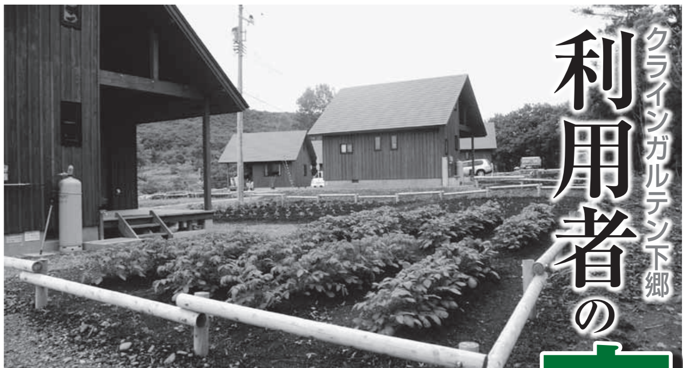
作物が成長し始めた農園