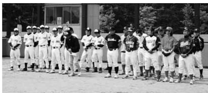
野球の交流試合に参加した両町村の選手たち