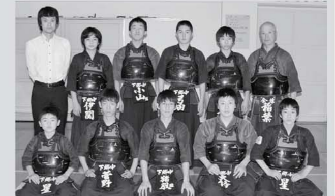
剣道 男子団体に出場する剣道部の皆さん