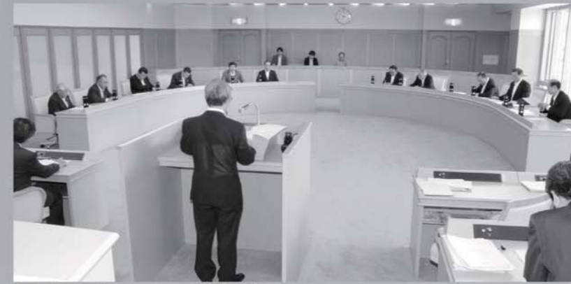
条例案が可決された6月定例議会

大震災の発生から一年以上が経過した現在。復興の足音は少しずつ大きくなっていきますが、本県においては同時に発生した原発事故が重い足かせとなつていきます。直接的被害の少なかつた町内においても、風評被害による影響は大きく雇用環境を悪化させています。県では、「ふくしま産業復興企業立地補助金」により企業誘致と雇用創出に努めていますが、補助金を申請した二九九件の企業のうち、採択されたのは一六七件。国から配分された予算額をはるかに超える申請があり、予算不足に陥つたためです。