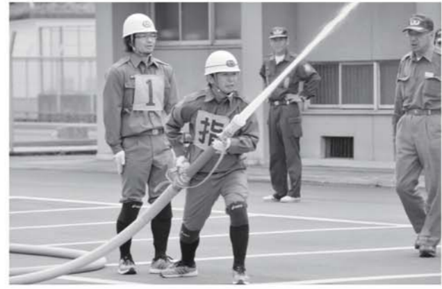
練習に励む団員（6月10日撮影）

小野岳の山開きは、五月二十七日、大内登山口で開催され、町内外から約二百名の登山客が参加しました。 山開きでは、関係者による安全祈願やテープカットが行われ、登山客は思い思いのペースで山頂を目指しました。 山頂では、恒例の小野岳コンテストが行われ、最高齢者や最年少者らに記念のメダルが贈られました。 参加者は、さわやかな汗を流しながら、新緑の絶景を堪能しました。