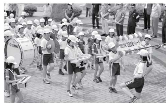
役場前で演奏を披露する児童

旭田小学校の交通安全パレードは、六月十三日、塩生地区で行われ、全校児童約百名が参加しました。 同小では、毎年この時期、南会津警察署など関係機関の協力の下、パレードを実施。交通安全意識の高揚に一役買っています。 小学校を出発した一行は、農協前や町公民館などを経由し町役場に到着。校歌などの演奏に乗せて、地域住民に交通事故の防止を呼びかけました。