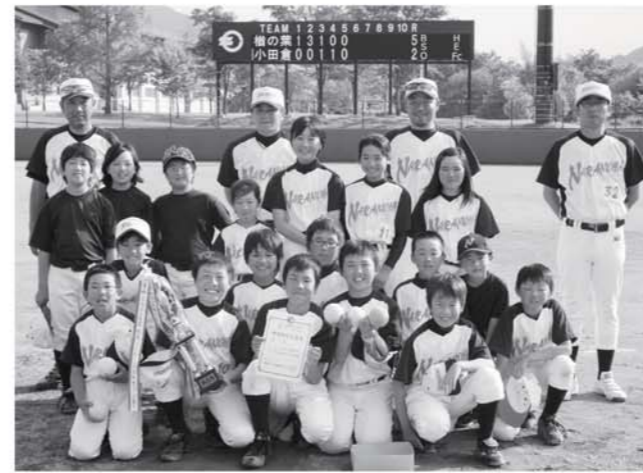
スポ少春季大会で優勝した櫛の葉チーム

交流ソフトボール大会が、ふるさと球場で開催され、県内のスポ少十六チームが出場し熱戦を繰り広げました。 また、六月二日には、本町と西郷村の体育協会による家庭人バレーボール交流大会がコミュニティセンターで行われ、親睦を深めました。