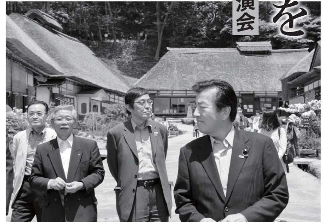
湯田町長らの案内で大内宿を視察する室井政務官(右)と井手長官(右から2人目)

室井政務官は「今年の秋に本県で開催される見通しの日中韓観光大臣会合などの場で『福島は安全である』ことを世界に発信していきたい」と国の支援を強調。続いて、井手長官が大震災後の観光客の動向や風評被害に対する観光庁の取り組みなどについて説明しました。