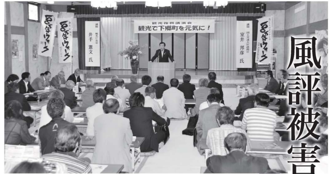
観光復興の重要性を説いた講演会