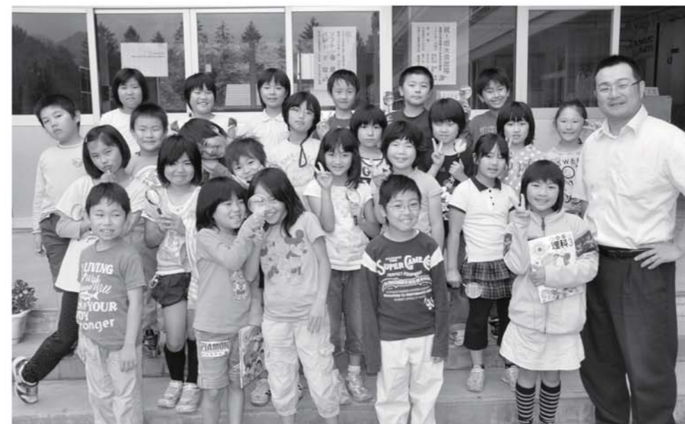
榎原小学校3年生の皆さん

納税には便利な口座振替を ■お問い合わせ 税務班 TEL0241-69-1155