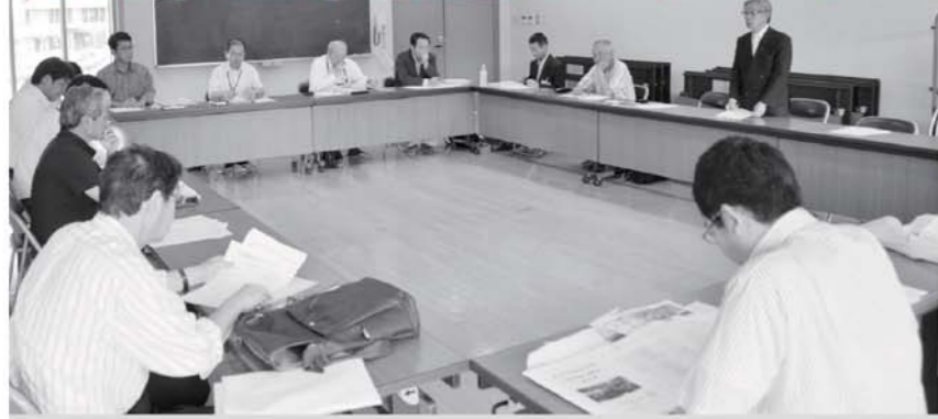
事業内容を確認した実行委員会 (6月17日・ふれあいセンター)

大震災からの復興などを指す「とうほく街道会議第八回交流会・会津五街道ウォーク合同大会」が、七月二十一日と二十二日、本町を中心に開催されます。六月十七日、ふれあいセンターにおいて、合同大会の実行委員会が開催され、最終的な事業内容などを確認しました。