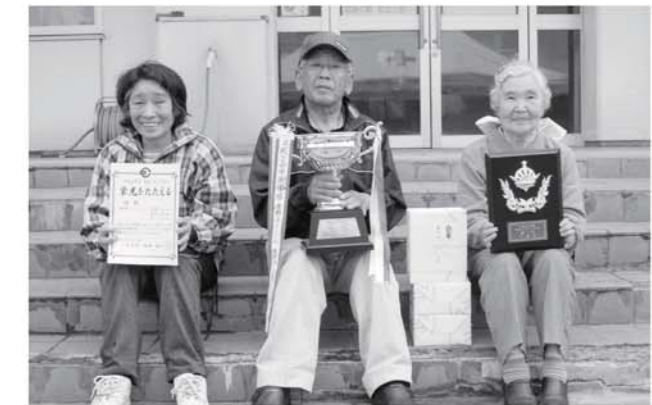
優勝した湯野上Dチームの皆さん