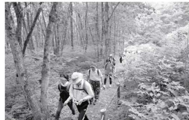
中山風穴を巡る参加者

町着地型ツーリズム推進事業実行委員会（事務局町商工会）が主催した「100万年ウオーク大高嶺バラ祭」は、六月三日に開催されました。 塔のへつりや中山風穴を巡る常設コースによる着地型観光事業の第二弾。今回は、中山風穴のオオタカネバラの開花時期に合わせて開催されました。 約二百三十名の参加者は新緑の下郷路を歩き、自然を満喫していました。