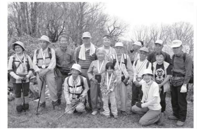
小野岳コンテストで入賞した皆さん

県消防操法南会津地方大会に向けた町消防団の公式練習は、六月十日から下郷中学校などで行われています。 同大会に出場するのは、塩生チーム（ポンプ車の部）と昨年の町大会を制した大内チーム（小型ポンプの部）。両チーム共に頂点を目指して早朝練習などに励んでいます。 大会は、七月八日に南会津町のだいくらスキー場で開催されます。多くの町民の皆様からの熱い応援をお待ちしています。