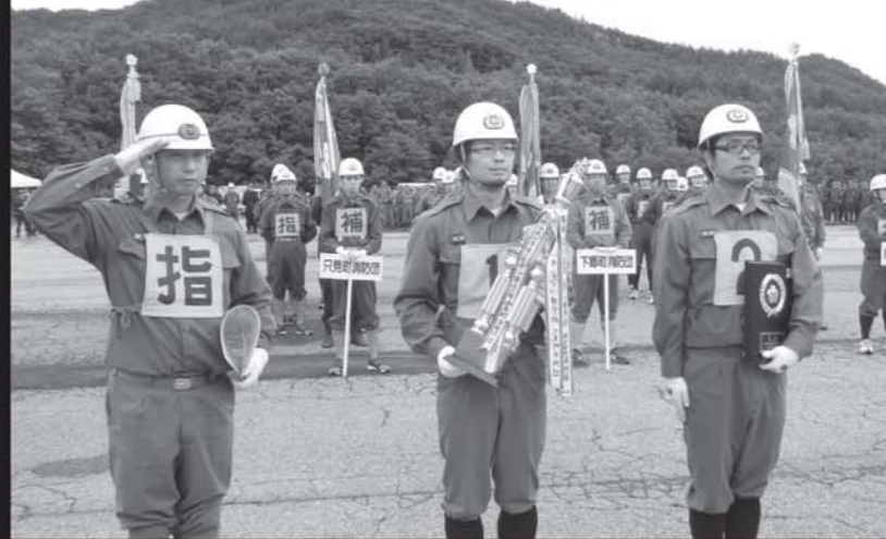
地方大会を制した大内チーム