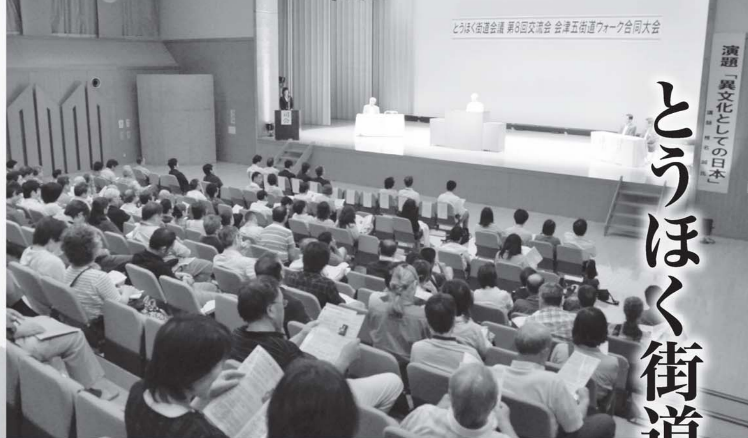
各地から参加者が集った交流会

参加者は、過去の災害発生時における街道の果たした役割や、茅葺きといった文化の継承などについて有識者らと熱心に意見を交わし、地域を守ってきた街道や文化の重要性を学びました。