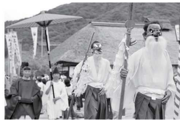
宿場内を練り歩く行列

八百年以上続くとされる伝統行事「大内宿半夏祭り」は、七月二日に大内宿で行われました。半夏祭りは、潜行伝説が残る悲運の皇子・高倉宮を祭る祭礼。高倉神社を出発した御渡行列が肅々と宿場内を練り歩き、来場者に夏の訪れを告げました。昨年は、大震災の影響により観光客が減少。今年は、大型観光バスでの来場も目立つなど風評被害の状況は改善しつつあるようです。