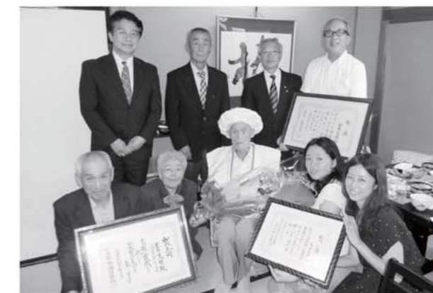
室井さん(前列中央)の長寿を祝った出席者