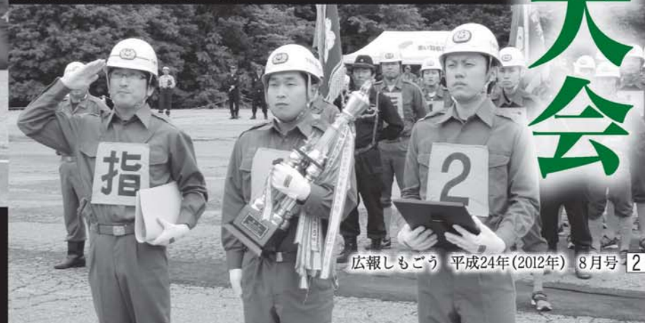
栄冠を手にした塩生チーム

20年ぶりの2部門制覇 7月8日、福島県消防操法南会津地方大会が南会津町のだいくらスキー場駐車場で開催されました。 大会には、郡内町村消防団が出場し、ポンプ車操法と小型ポンプ操法の2部門で訓練の成果を競いました。 激戦を制したのは、塩生チーム(ポンプ車)と大内チーム(小型ポンプ)。同大会での町消防団の2部門制覇は20年ぶりの快挙です。