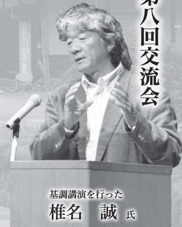
基調講演を行った 椎名 誠 氏

続いて、作家の椎名誠氏が「異文化としての日本」と題した基調講演を行いました。椎名氏は各国を巡った体験談を交えながら、「日本の豊かな自然や水、文化などは世界的にも類まれなもの。我々はその大切さを決して忘れてはならない」と来場者に訴えました。