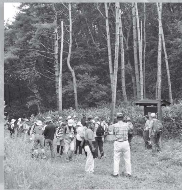
松川街道を歩く参加者

合同大会には、東日本の各地から参加者が集いました。大震災以後初めて来県した参加者もあり、県外の方に福島への理解を深めていただく契機となりました。参加者は、福島の復興を支えようとする「会津の元気」を感じとってくれたはずです。今大会の交流が将来にわたる深い絆となり、本県復興の一助となることを願います。