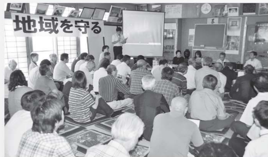
意見を交換した分科会