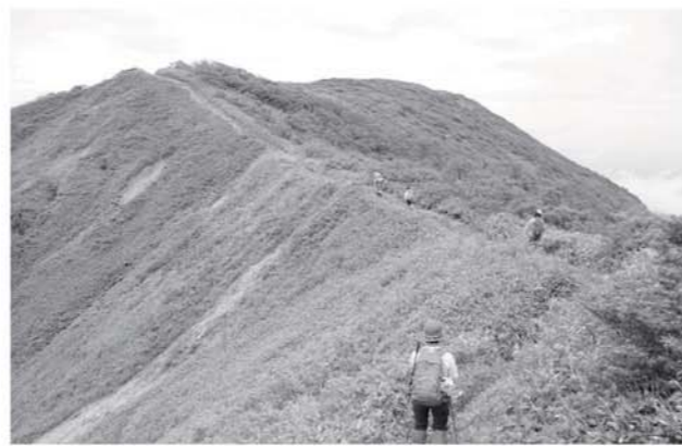
稜線を歩く参加者

第十五回三倉山々開きは、七月十五日に開催され、町内外から約三百七十名が参加しました。音金の上坪登山道入口で行われた開催式典では、関係者が待望のシーズンインをテープカットで祝いました。参加者は、思い思いのペースでニッコウキスゲが咲き誇る大峠や雄大な景色が広がる流石山と大倉山を巡り、標高一八八八メートルの三倉山を目指しました。