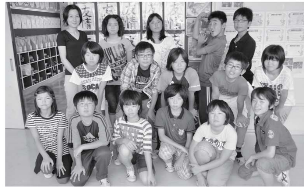
旭田小学校6年生の皆さん

納税には便利な口座振替を ■お問い合わせ 税務班 TEL0241-69-1155