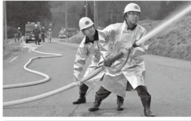
訓練に臨む姿は真剣そのもの（小出地区）