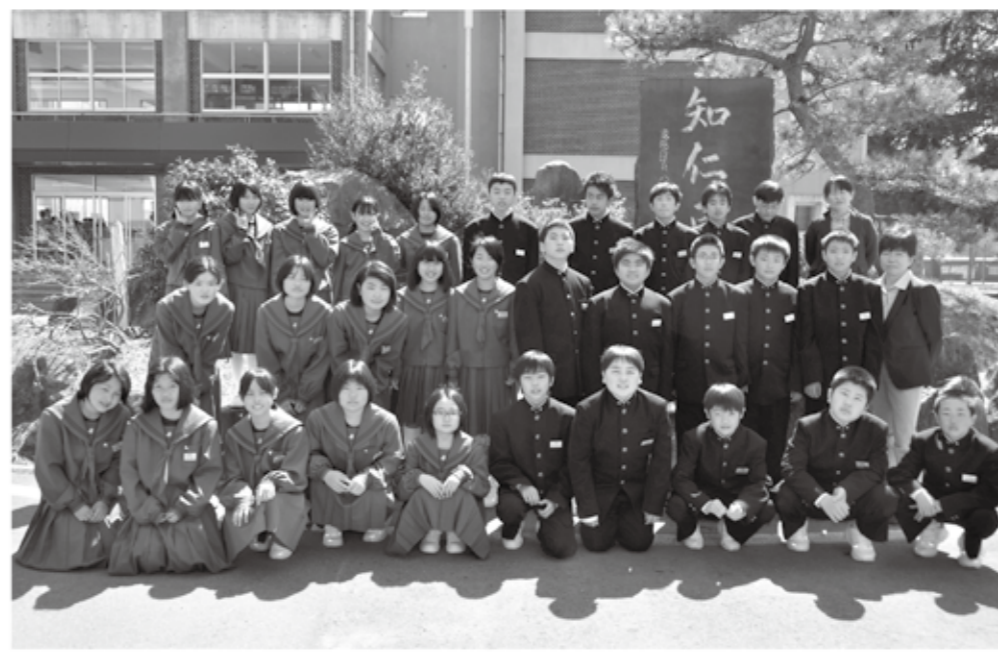
下郷中学校1年1組の皆さん

納税には便利な口座振替を ■お問い合わせ 税務課 TEL0241-69-1155