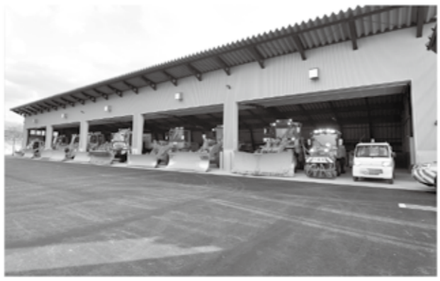
新しい除雪重機車庫

町が旧ごみ処理センター跡地（中妻）に建設を進めてきた除雪重機車庫が完成し、4月11日、タイヤドリーザなど計13台の除雪車両等が初めて格納されました。新重機車庫は高さ7・65メートル、横幅は54メートルもあり、大きな除雪重機も小さく見えてしまうほどの大きさです。次の除雪シーズンまでの間、除雪車両たちは新しい車庫の中でしばしの休息に入ります。