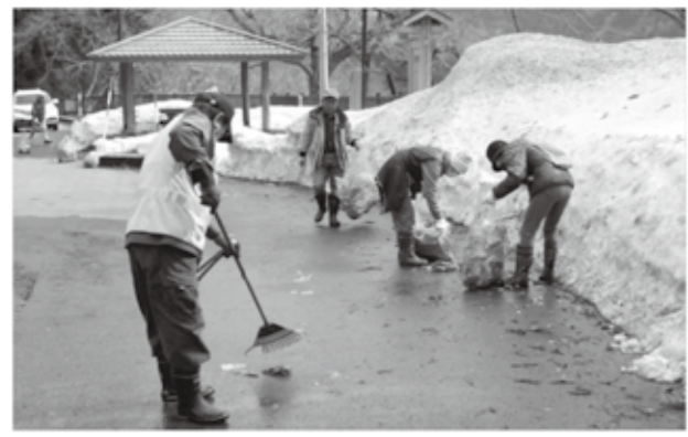
雪解け後の道路には大量のごみが散乱

町消防団は、4月20日早朝、町内3カ所（南倉沢、中山、小出）で春季非常招集訓練を実施しました。メイン会場の小出地区では、「林野と神社の2カ所から出火」との想定に基づき、第3分団の消防車両が続きと集結。団員が消防ポンプやホースなどを手際よく接続し、「迅速かつ安全な消火」のための手順を確認しながら、本番と同様の緊張感で訓練に当たっていました。