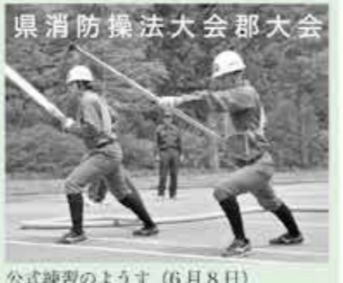
公式練習の様子 (6月8日)

県消防操法大会南会津郡大会は、7月6日にだいらスキー場(南会津町)で開催されます。 本町からは刈林チーム(ポンプ車の部)と芦の原チーム(小型ポンプの部)が出場します。