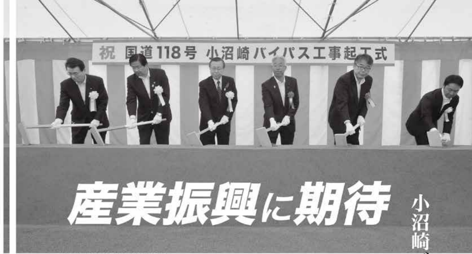
工事の安全を願う関係者