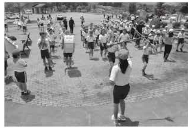
役場前で演奏を披露する児童

6月7日、下郷中学校グラウンドで、本町と西郷村の体育協会が主催するスポーツ交流会が開かれました。 国道289号で結ばれた隣接町村同士が、様々なスポーツを通じて交流を深めようと毎年実施しているものです。 15回目となる今回はソフトボールの試合が行われ、両町村合わせて約30人が白球を追いかけ親睦を深めました。 試合は、下郷町チームが6対4で逆転勝ちを収めました。