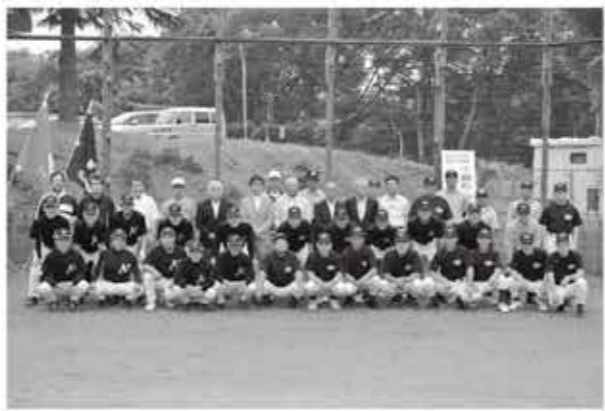
ソフトボールで交流を深めた参加者たち

6月17日、旭田小学校の交通安全パレードが塩生地区で行われ、全校児童約100名が、校歌などの演奏を通じて交通安全を訴えました。 小学校をスタートした児童たちは、先導する南会津警察署のパトカーに続き、塩生地区内を元気にパレード。最後に、町役場前広場で演奏を披露しました。 沿道には地域住民や保護者らが詰め掛け、交通安全のメッセージに耳を傾けていました。