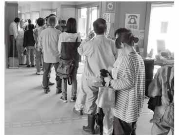
購入のため列を作る来場者（6月14日・ふれあいセンター）

20%の付加価値の付く地元券は3日で完売する好評ぶり。10%の共通券もなくなり次第販売が終了となります。ご希望の方はお早めに購入ください。