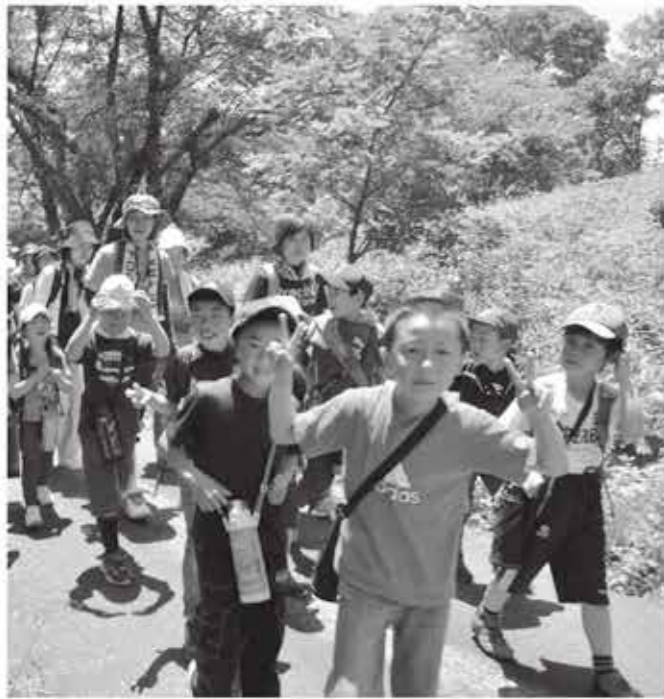
学年行事で参加した檜原小の3年生