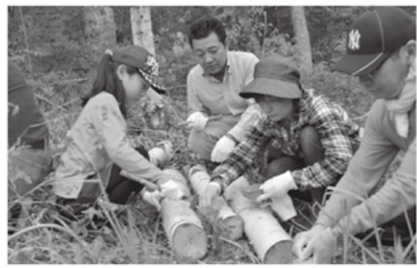
植菌体験にいきそむサポーターの皆さん