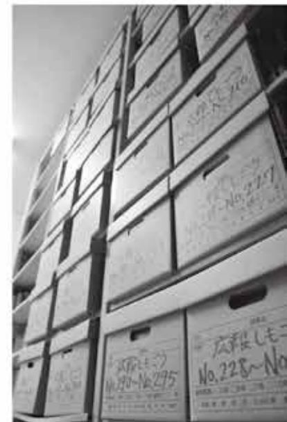
これまでの広報紙は保蔵箱に保管(町役場)

広報しもごうは、今月で600号。これまで多くの町民の皆様に支えられてきたことに、改めて感謝いたします。第1号の発行から52年。半世紀以上にわたる紙面には町の歴史が記されています。掲載された記事や写真は「過去の町の姿」を知る貴重な資料となっていくことでしょう。 また、町民の皆様も追いついてきました。各分野で努力を重ね活躍した方々や夢を追う若者の姿、かわいらしい子どもたちの笑顔などが掲載されています。 過去の紙面を振り返れば「あの日の下郷」「あの日の自分」に再会できるかもしれません。 記念すべき今月号では、過去の紙面とこれまで寄せられてきた皆様のご意見の一部を紹介いたします。