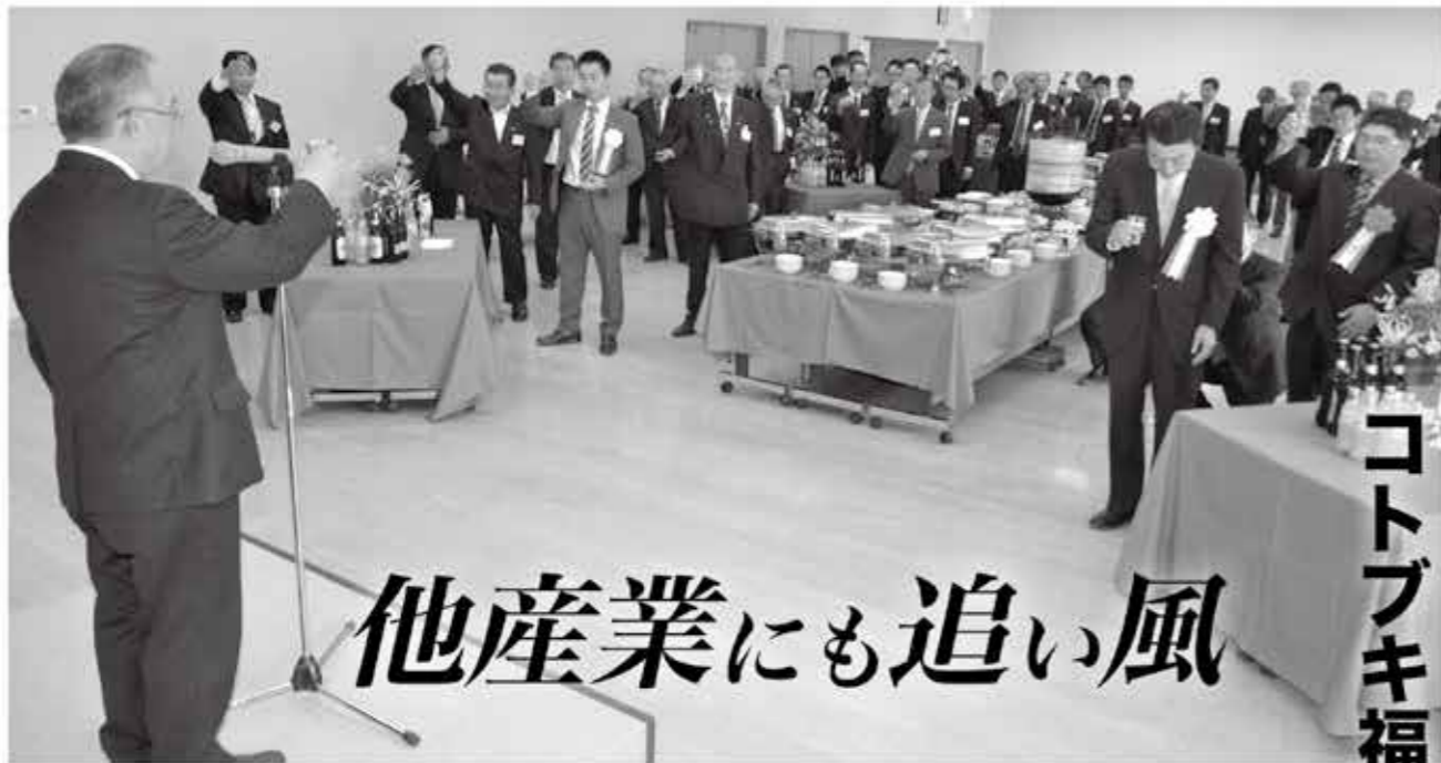
工場の落成を祝う出席者