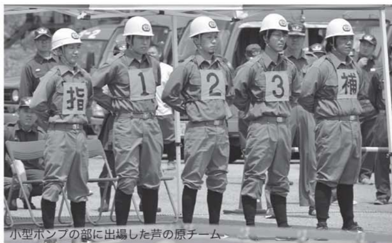
小型ポンプの部に出場した芦の原チーム

■大会の結果▼ポンプ車①只見町②南会津町③下 郷町▼小型ポンプ①南会津町②只見町③松枝岐村