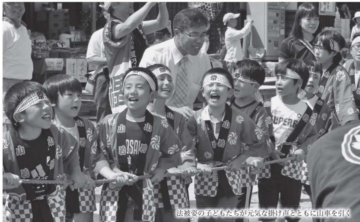
法被姿の子どもたちが元気な掛け声とともに山車を引く