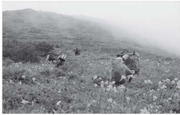
ニッコウキスゲが咲き誇る大峠を進む登山客

第17回三倉山山開きは、7月20日に開催されました。町内外から約350名の登山客が参加。登山口では式典が開かれ、関係者が待望のシーズン入りを祝うテープカットなどを行いました。