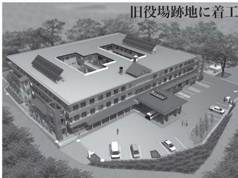
「レジデンスふじの郷」完成予想図

町役場・旧町公民館跡地（塩生）を貸与。入所待機者の解消と新たな雇用の創出に向けた協力をしてきました。同ホームは地上3階建て、100床（うち短期入所20床）を有する計画で、平成27年5月の完成を目指しています。ヘルパーや事務職等、あわせて約60名の雇用が見込まれています。