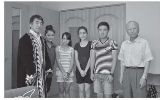
来庁した講座生ら一行と室井副会長(右)