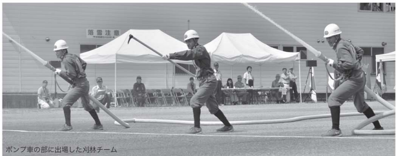
ポンプ車の部に出場した刈林チーム