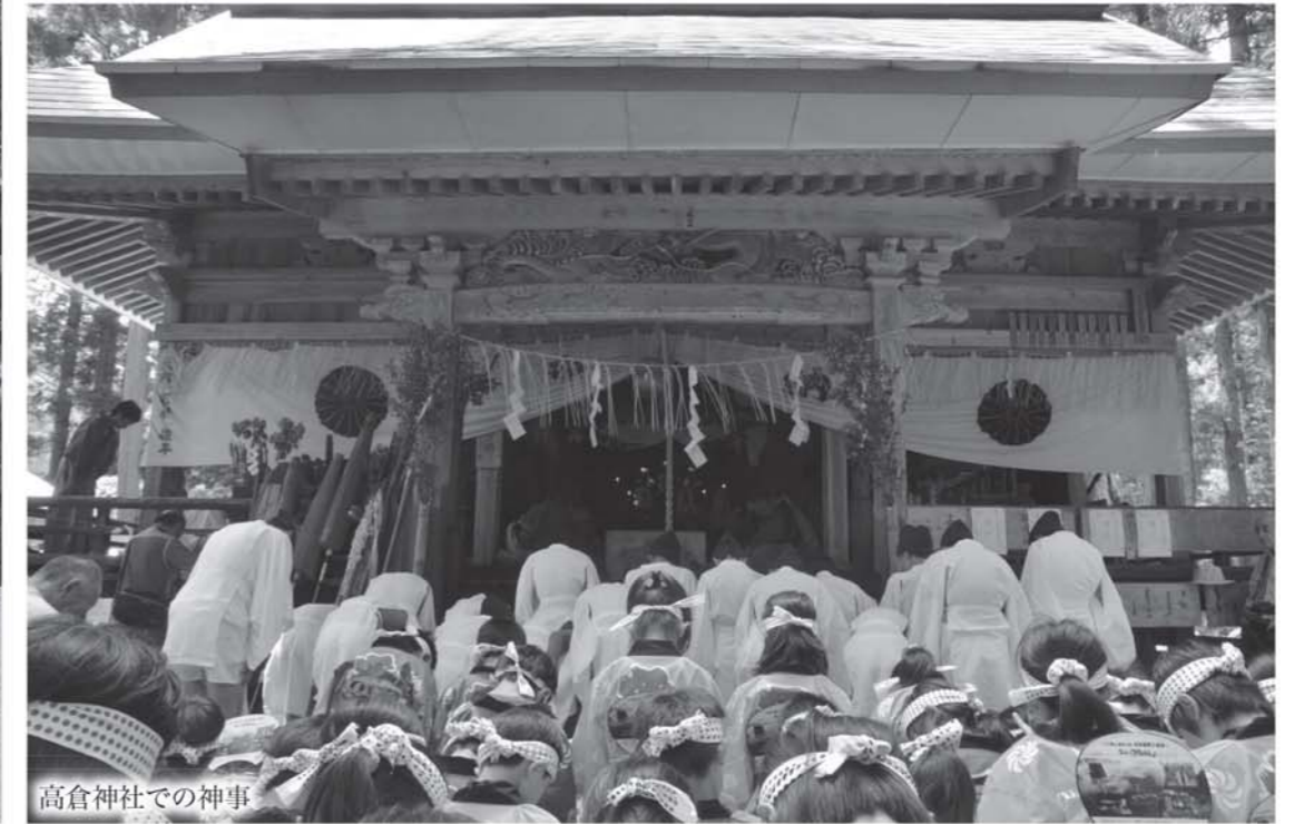
高倉神社での神事