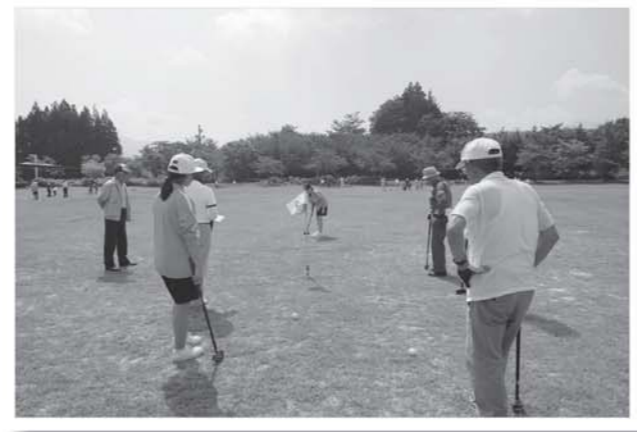
世代を超えてグラウンドゴルフに熱中した会場

7月12日、大川ふるさと公園で青少年健全育成世代間交流グラウンドゴルフ大会が開催され、15チーム約100名が参加しました。