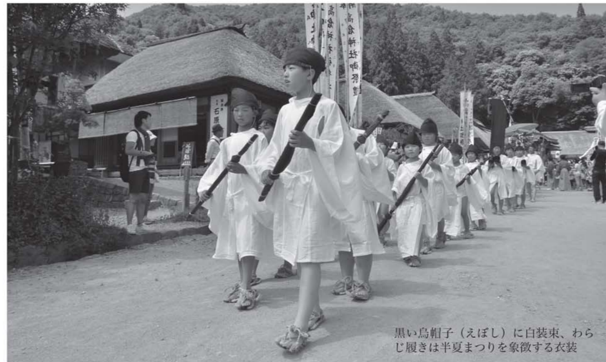
黒い烏帽子（えぼし）に白装束、わらじ履きは半夏まつりを象徴する衣装

白装束をまとって行列に加わったり、法被姿で「ヤツカシヨ」の元気な掛け声とともに山車を引いたりしながら、祭りの盛り上げに大きな役割を果たしています。 やがてこの子の中から、祭りを次世代に伝える者が現れ、伝統は脈々と受け継がれていくのです。