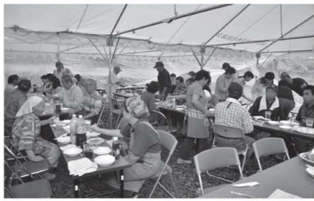
バーベキューに舌鼓を打ちながら交流を深める参加者

7月19日、滞在型市民農園「クラインガルテン下郷」のクラブハウスで、同施設の利用者同士の親睦を図ろうと「納涼祭」が開かれました。