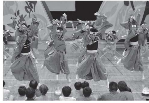
躍動感あふれる演舞を披露した郷人こめらの皆さん

札幌市で開かれた第23回YOSAKOIソーラン祭りでも、優秀賞を受賞した郷人と郷人こめらの報告会は、6月28日にコミュニティセン