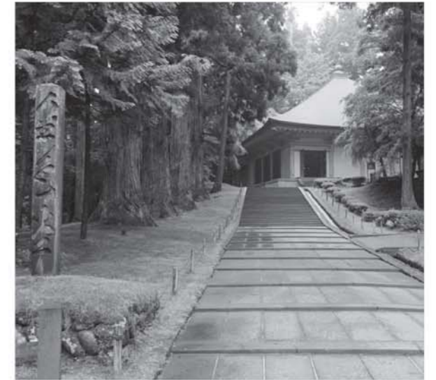
中尊寺金色堂への参道