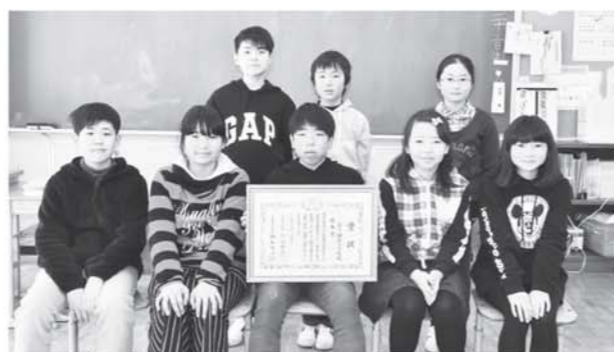
▲環境栽培委員会の皆さん

地 球温暖化防止に取り組む平成29年度「福島議定書」において、学校版の優秀賞に楢原小学校が選ばれました。同校は環境栽培委員会を中心として、学校内の節電や節水に取り組んできました。その他、取り組みを促すためにコンテストを開催。節電、節水に一番貢献した学年を表彰するなど、児童の参加意欲を向上させる工夫もしました。これからも二酸化炭素削減へ向け、学校全体で取り組んでいきます。