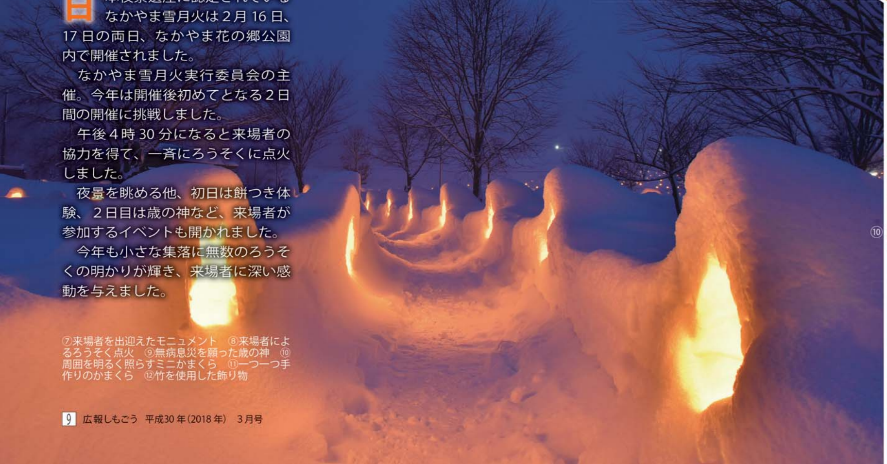
⑦来場者を出迎えたモニュメント ⑧来場者によるろうそく点火 ⑨無病息災を願った歳の神 ⑩周囲を明るく照らすミニかまくら ⑪一つ一つ手作りのかまくら ⑫竹を使用した飾り物