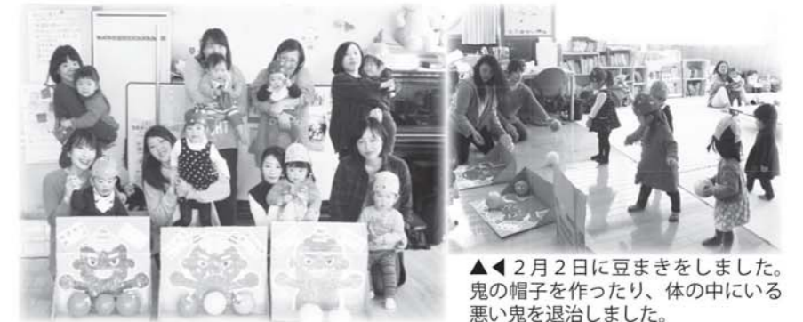
▲◀2月2日に豆まきをしました。鬼の帽子を作ったり、体の中にある悪い鬼を退治しました。

地域子育て支援センターでは、毎月楽しい行事を計画しています。たくさんの方の参加をお待ちしています。