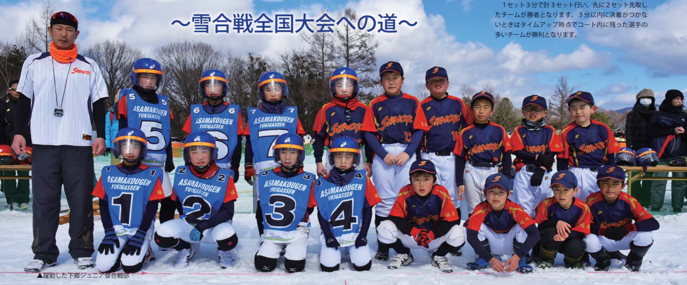
▲躍動した下郷ジュニア雪合戦部