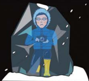
広報くん (冬 Ver.)