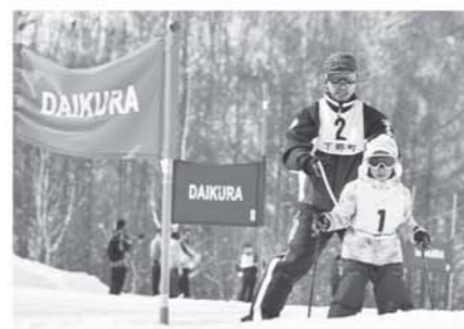
▲親子レースを滑走する参加者

第49回 町民スキー大会は2月25日、だいくらスキー場で開催されました。町の主催。今回は9部門に町内から約30名が参加しました。