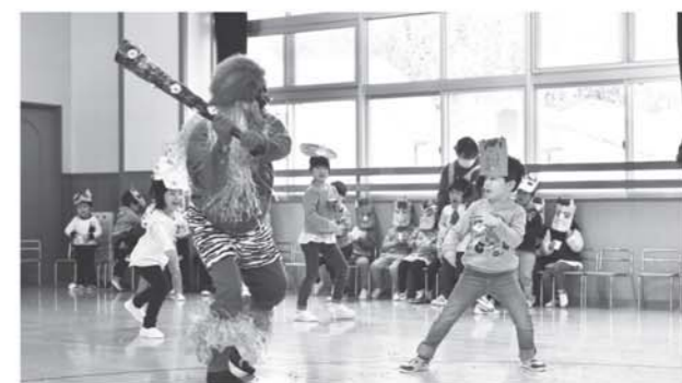
▲鬼退治する園児たち

節 分の豆まきは2月2日、しもごう保育所において開かれました。園児たちは、それぞれが手作りしたお面を付けて、節分の歌をうたったり、先生による紙芝居で節分の由来を勉強しました。その後は、自分の中にいる泣き虫鬼や病気鬼など、お互いに退治し合いました。最後には、先生が扮した鬼が登場し、「鬼は外」と豆まきをして、伝統行事に触れ合いました。