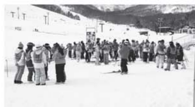
▲下郷中スキー教室

各校では卒業式の練習も始まりました。3月の本番に向け児童生徒は一生懸命練習に取り組んでいます。