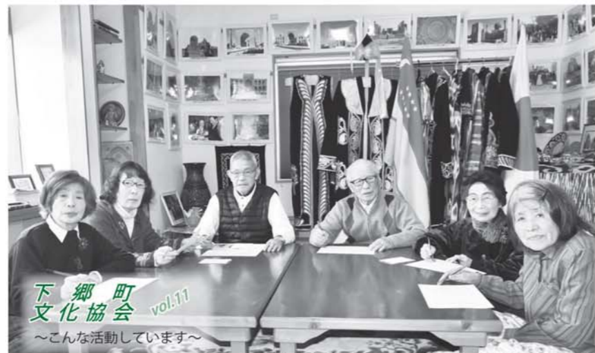
下郷町文化協会 vol.11 ～こんな活動しています～