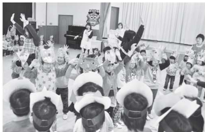
▲互いの鬼を追い払う園児ら

しもごう保育所の豆まきは2月3日、保育所において開かれました。始めに、紙芝居で節分の由来を勉強。その後、各自作成した鬼のお面をかぶり、自分の中にある鬼を園児同士で退治しました。赤鬼と青鬼の登場では、「鬼は外、福は内」と言って豆まきする園児や怖がって泣いてしまう園児もいました。昔の風習を学ぶ良い経験になりました。