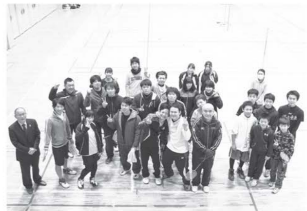
▲大会に参加した皆さん

第13回教育長杯バドミントン大会は1月31日、コミュニティセンターにおいて開催されました。町教育委員会が主催、スポーツクラブすいっちが主管を務め、ダブルス3部門に分かれ、熱戦を繰り広げました。結果は次のとおりです。 ◇1部▽①若商OB②すいっちBチーム③中央病院B◇2部▽①Becky②ABC③さよさや◇3部▽①ゆうしょう②ミートソーズ③チーム仲川・君島