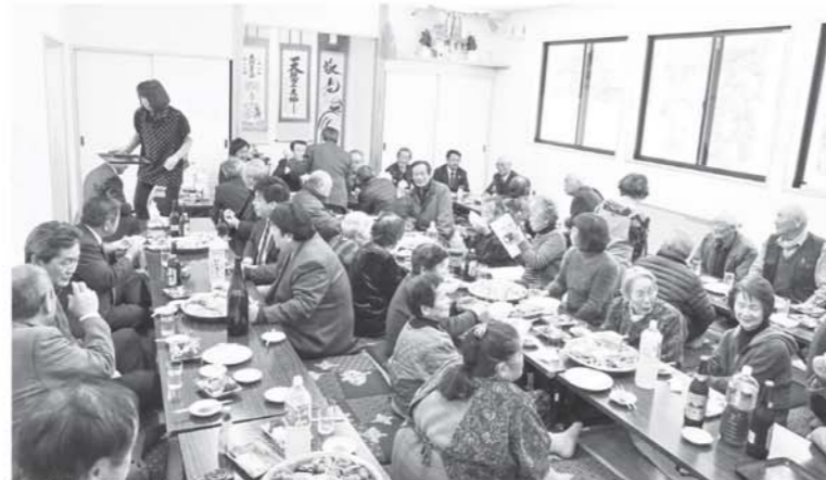
▲多くの出席者でにぎわった祝賀会