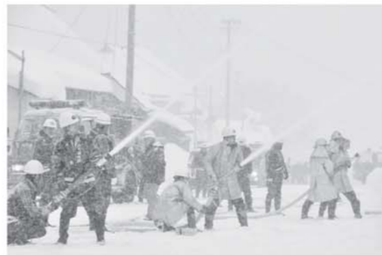
▲大雪の中、懸命に取り組む団員の皆さん

文化財防火デー(1月26日)に合わせ、町文化財防火訓練が1月24日、戸赤地区の国登録文化財建造物の小椋家住宅近くで実施されました。54人が参加した今回は、サ