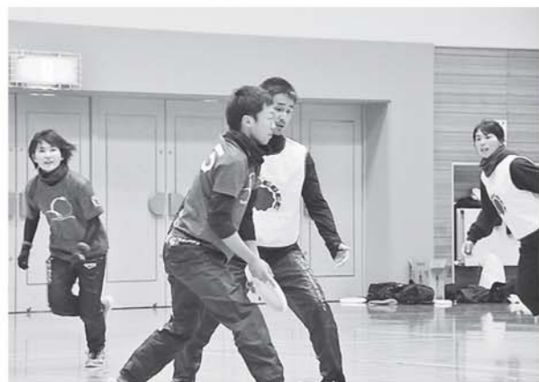
▲雨により室内で実地されたアルティメット競技