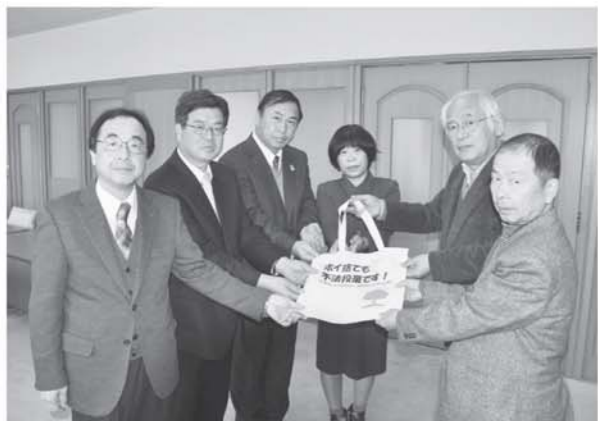
▲町役場で開かれた贈呈式