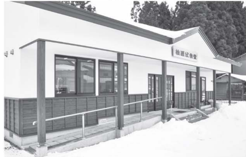
▲落成を迎えた桧原公会堂