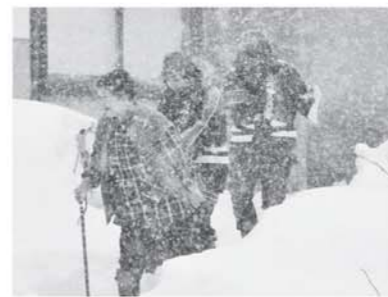
▲住民を誘導する婦人消防隊

イレンとともにポンプ積載車に乗った消防団員が駆け付け、水利確認やホース延伸などを訓練しました。婦人消防隊も住民誘導や初期消火訓練に取り組みました。大雪の中、息を合わせた防火訓練で、文化財保護に向けた意識を高めました。