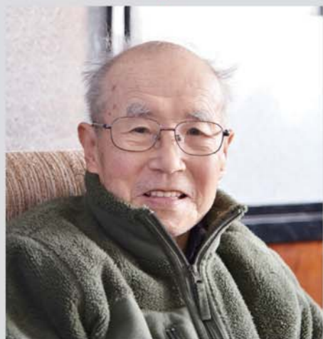
第3、4回雪まつり実行委員会