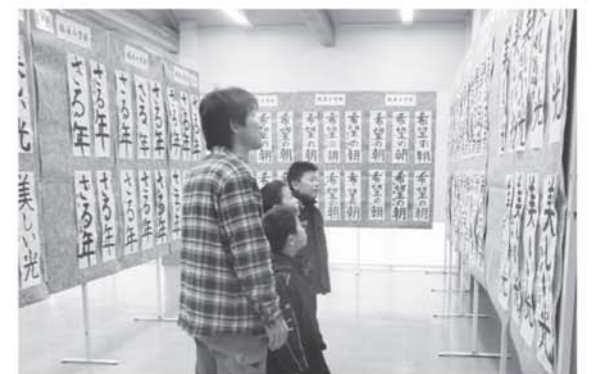
▲展示された各作品を鑑賞する来館者