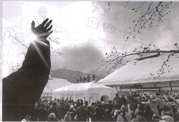
前回の金賞作品 「イベントに輝き」 矢作 武一様