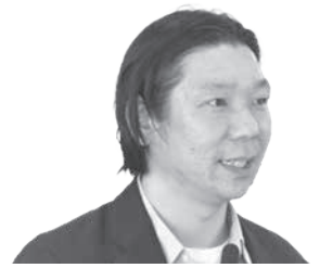
星 和志 議員 kazushi hoshi