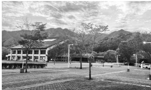
▶ 大川ふるさと公園