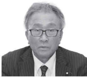
渡部 哲 議員 tetsu watanabe