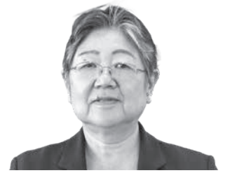
山名田 久美子 議員 kumiko yamanada