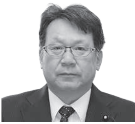
星 邦一 議員